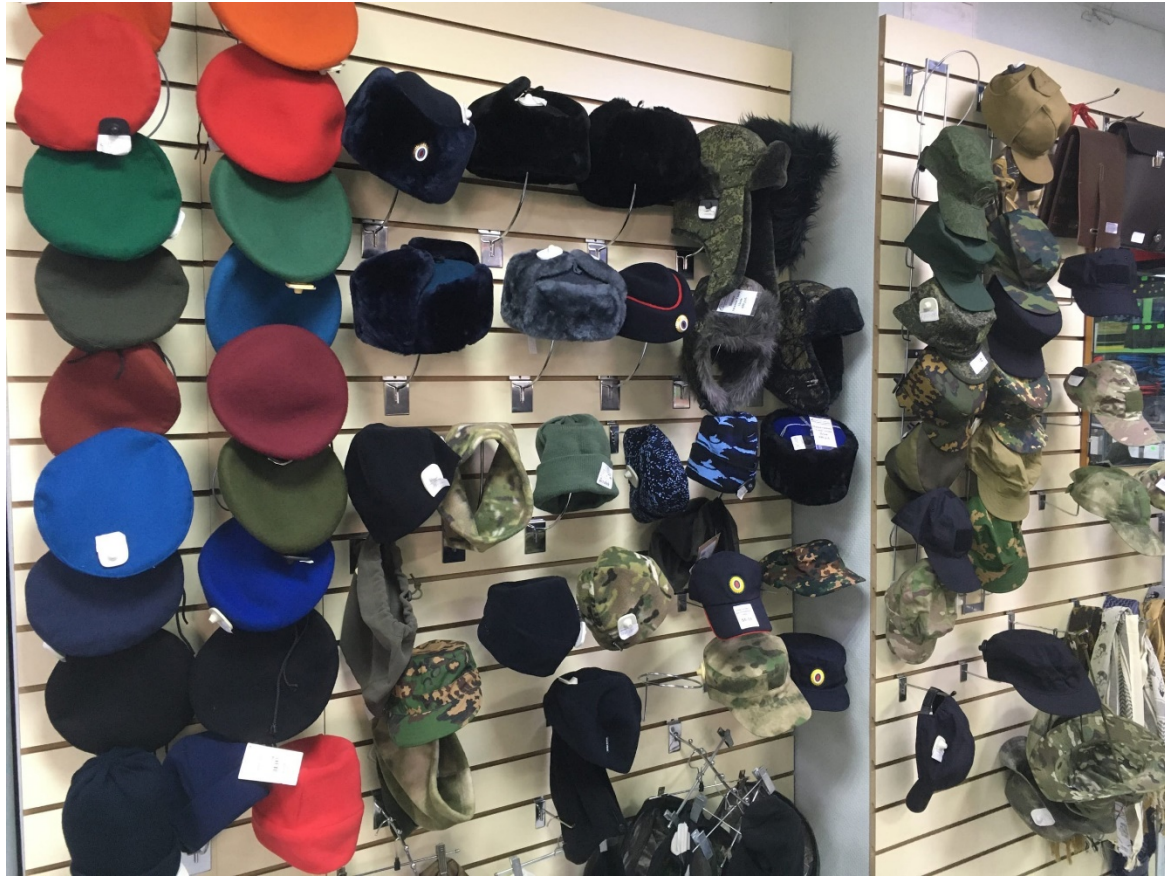
Более 30 позиций головных уборов