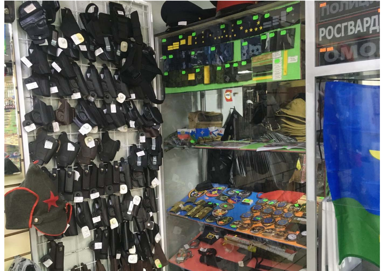
Более 80 позиций спец. средств